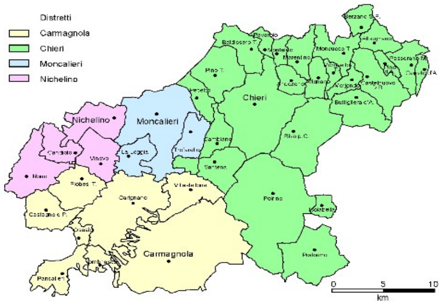
Fig. 1. I 40 comuni dell'ASL TO5 suddivisi per distretti

La popolazione dell'ASL TO5 presenta un trend demografico in costante aumento negli ultimi 16 anni (+0,50% medio annuo circa), come da grafico sottostante (Fonte: Osservatorio Demografico Territoriale del Piemonte):